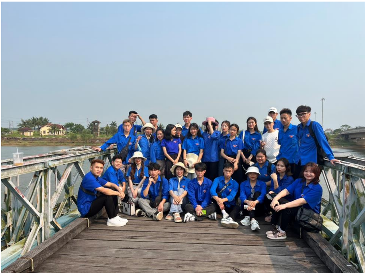
Trên cây cầu Hiền Lương lịch sử