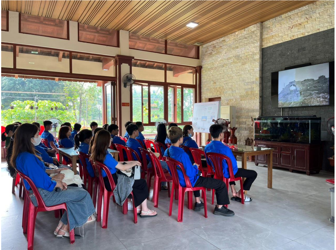
Đoàn xem phim tư liệu về Quảng Trị và Thành cổ Quảng Trị