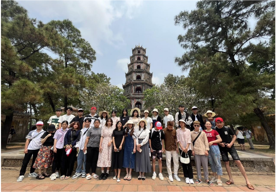
Đoàn chụp hình lưu niệm trước Chùa Thiên Mụ