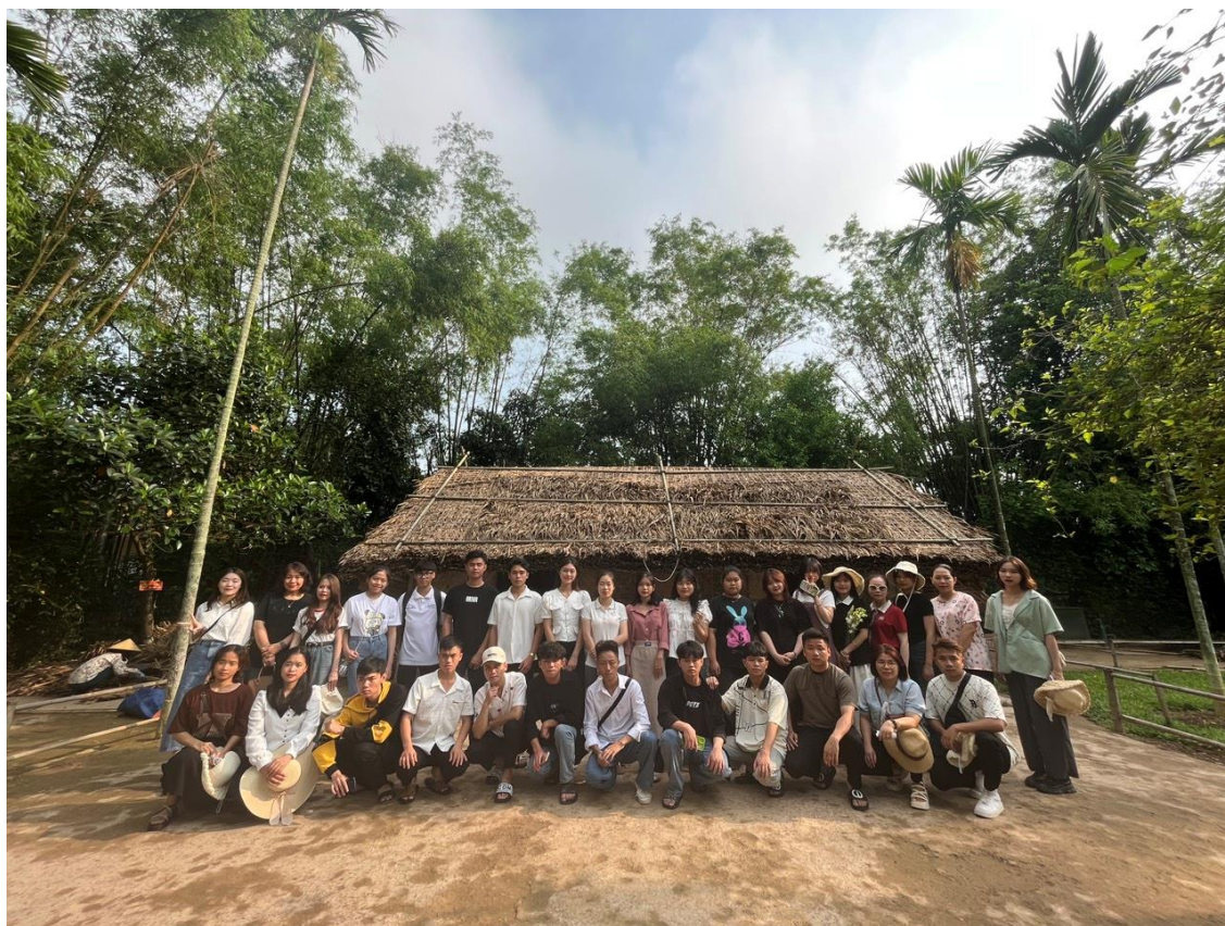
Đoàn thực tế chụp ảnh lưu niệm tại quê ngoại của Bác Hồ