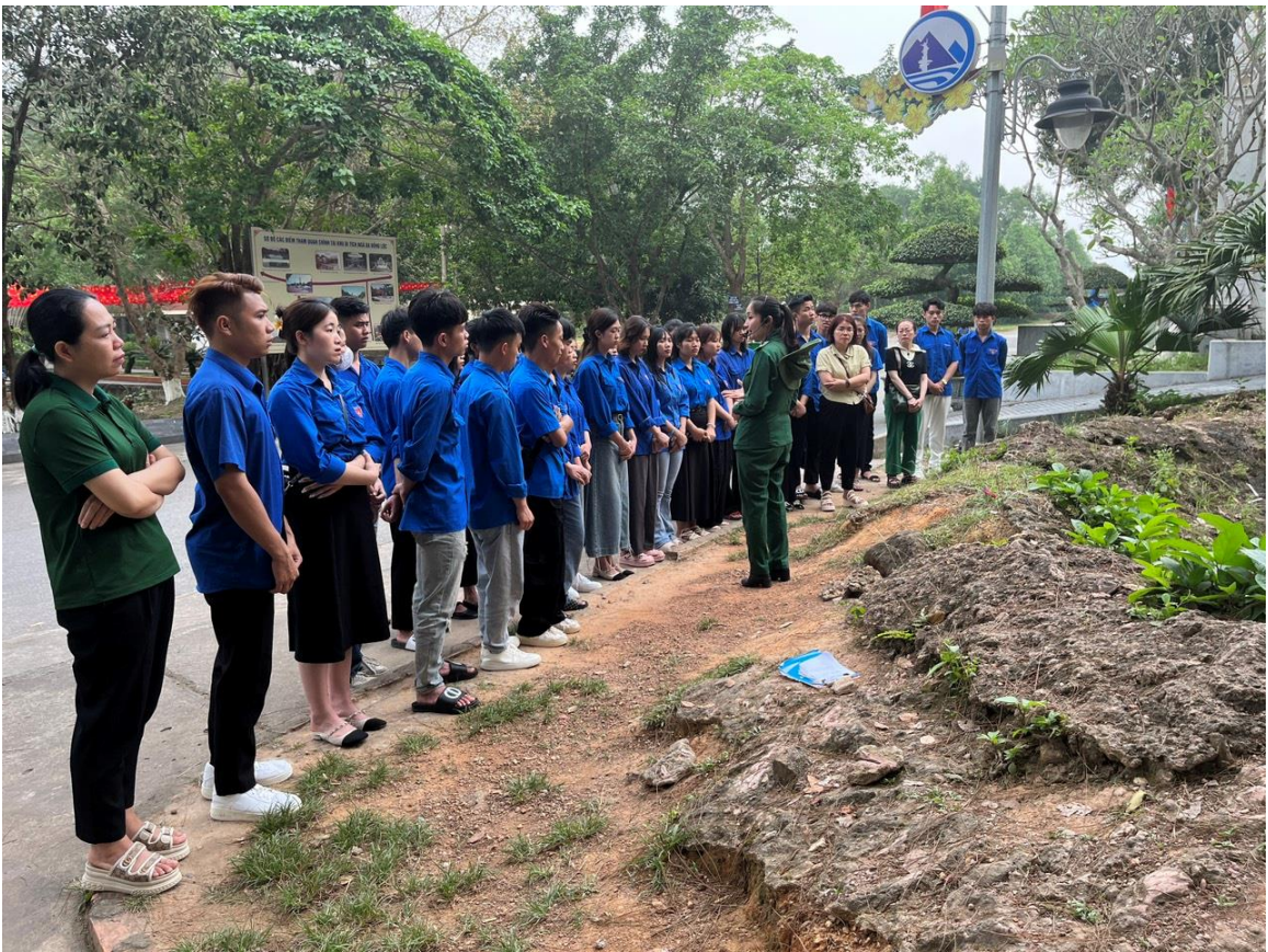
Đoàn nghe thuyết minh tại di tích Ngã ba Đồng Lộc