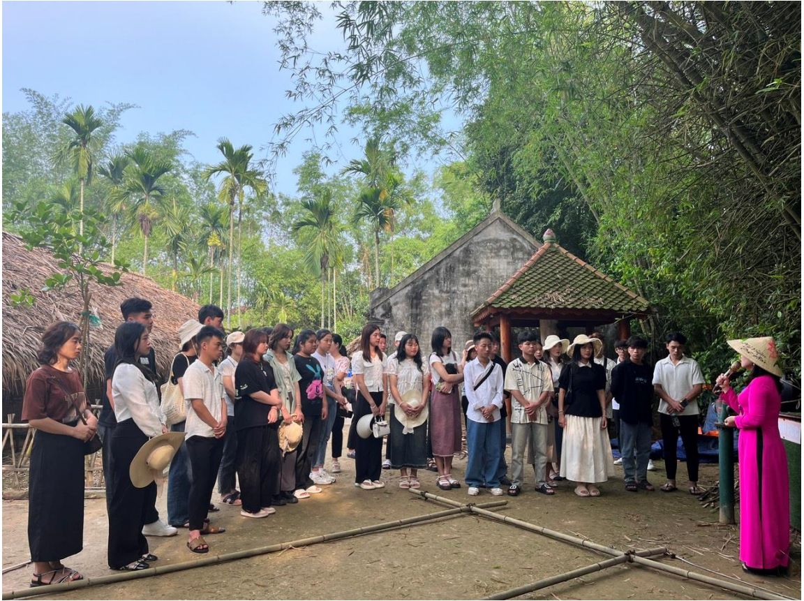
Đoàn nghe thuyết minh tại quê ngoại Bác Hồ