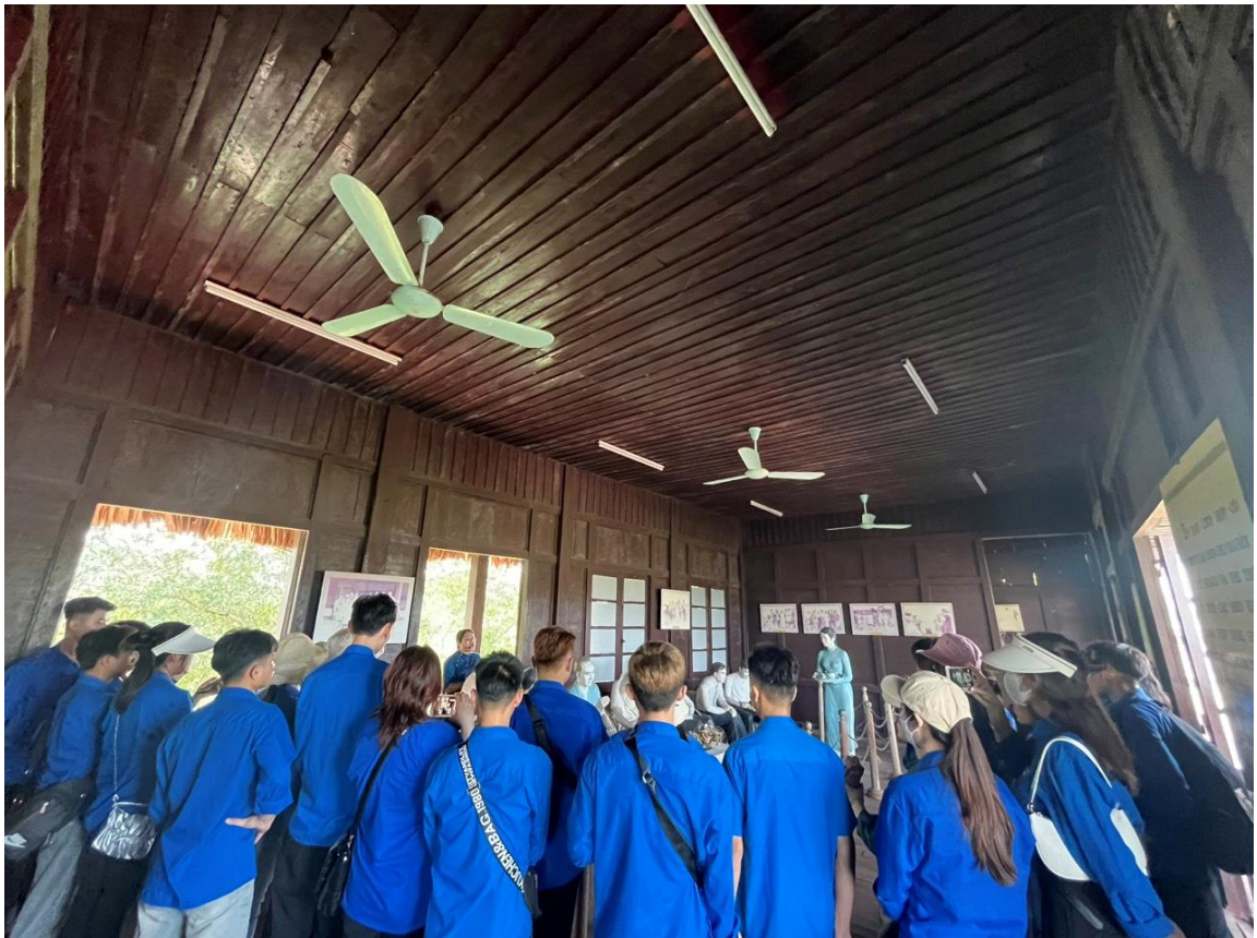
Đoàn nghe thuyết minh giới thiệu trong nhà Liên hợp