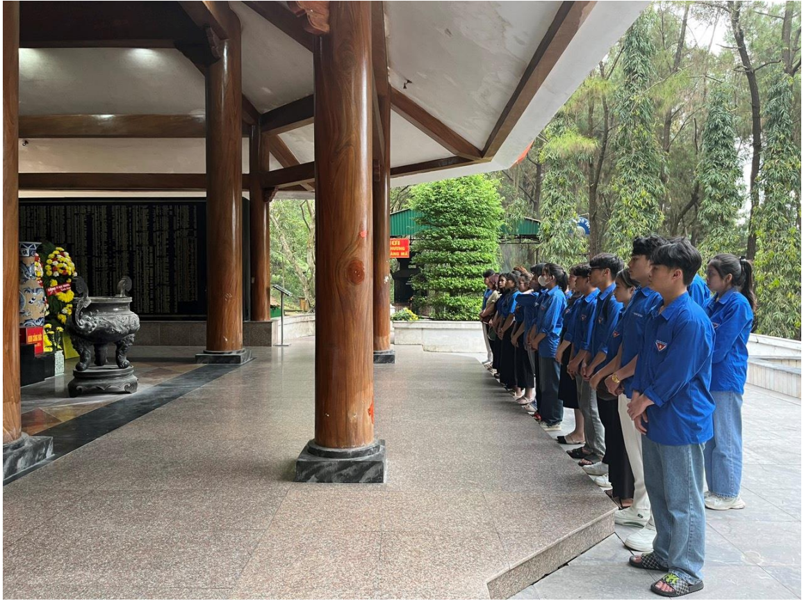
Đoàn dâng hương tưởng niệm tại di tích Ngã ba Đồng Lộc