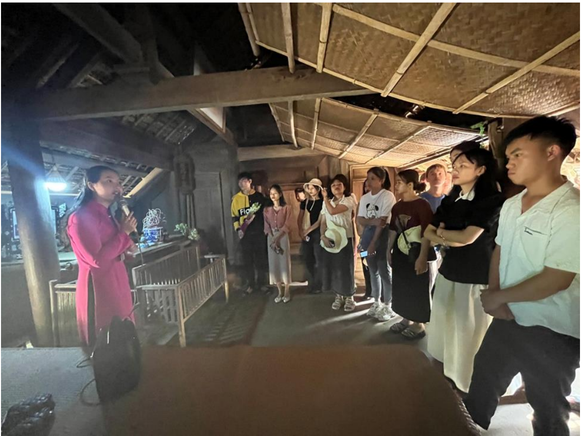
Đoàn nghe thuyết minh tại quê nội Bác Hồ