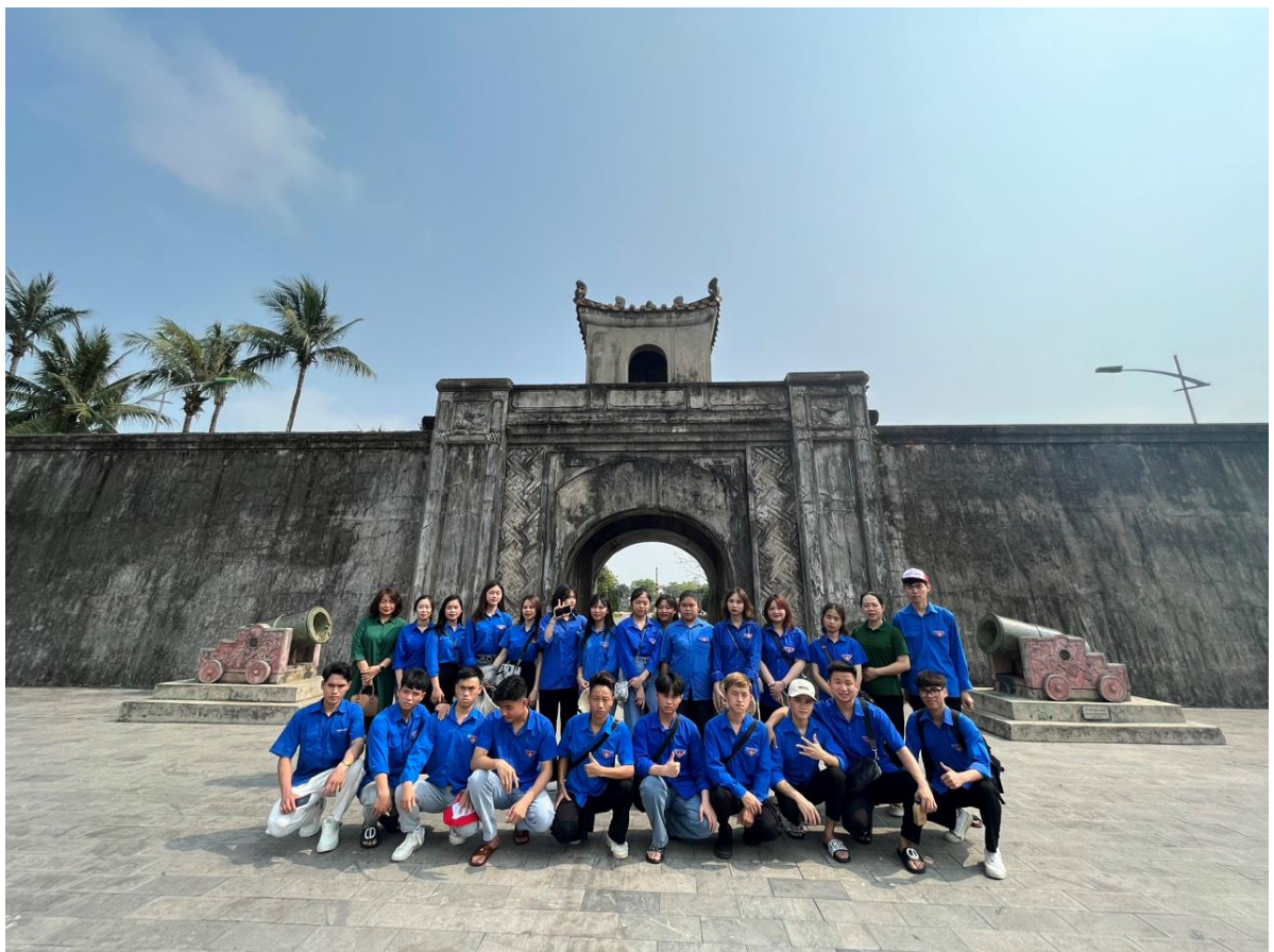
Trước Thành cổ Quảng Trị

Tại Quảng Trị, đoàn còn đến thăm Thành cổ Quảng Trị để ngược dòng thời gian trở về những năm tháng lịch sử của cuộc kháng chiến chống Mỹ cứu nước, Quảng Trị là một địa danh được biết đến bởi sự chia cắt đau thương, sự chịu đựng đạn bom ác liệt và ý chí kiên cường bất khuất của con người nơi đây. Chỉ trong 81 ngày đêm với chiến dịch tái chiếm Thành Cổ, số bom đạn mà quân đội Mỹ ném xuống tương đương với sức công phá của 7 quả bom nguyên tử mà Mỹ đã ném xuống Hirôshima (Nhật Bản) năm 1945. Tại mảnh đất này, hàng ngàn người con ưu tú của Tổ quốc đã ngã xuống đem theo tuổi thanh xuân, đem theo bao ước nguyện hóa thân vào lòng đất.