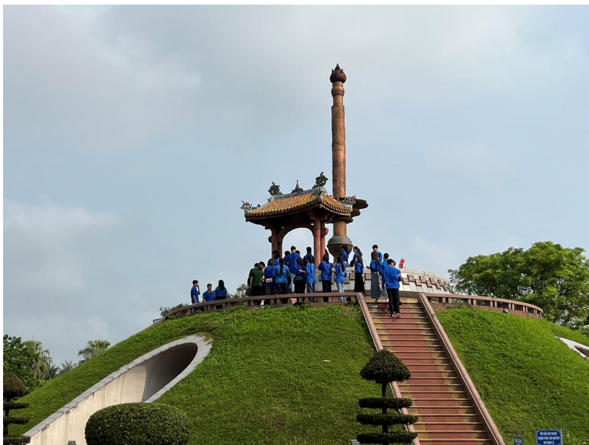
Đoàn dâng hương tưởng niệm các anh hùng liệt sĩ đã hy sinh anh dũng trong trận chiến 81 ngày đêm tại Thành cổ