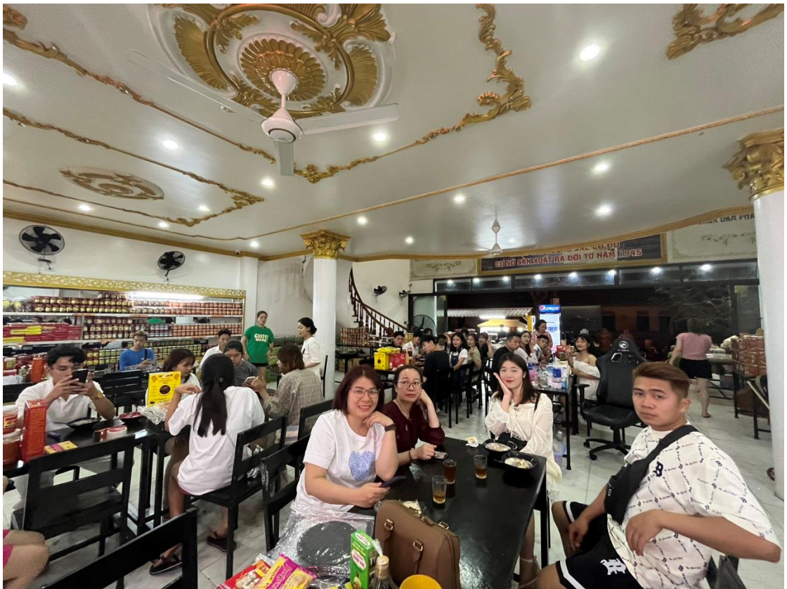
Đoàn thưởng thức món chè đặc sản cung đình Huế