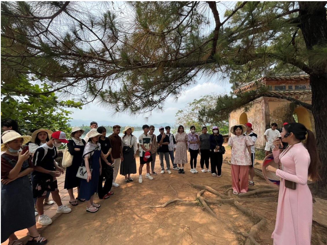
Đoàn nghe hướng dẫn viên giới thiệu về lịch sử ngôi chùa cổ kính trên đồi Hà Khê