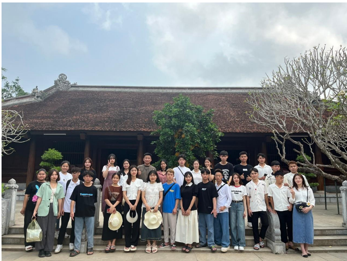
Đoàn thực tế chụp hình lưu niệm trước nhà tưởng niệm Chủ tịch Hồ Chí Minh