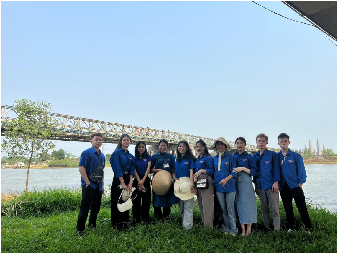
Các sinh viên chụp hình lưu niệm với hướng dẫn viên bên Cầu Hiền Lương và sông Bến Hải