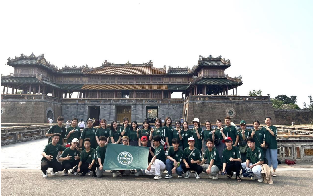
Trước Ngọ môn – Đại nội Huế