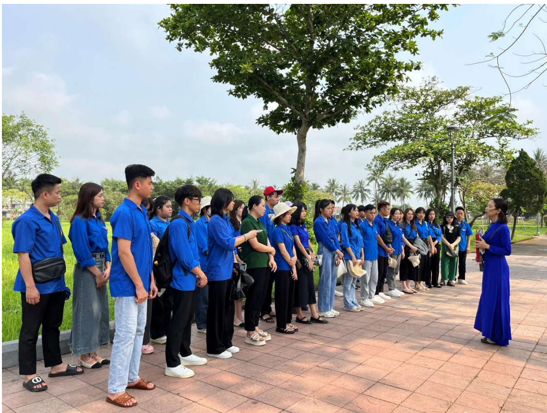
Các sinh viên chăm chú lắng nghe, học tập tại Thành cổ