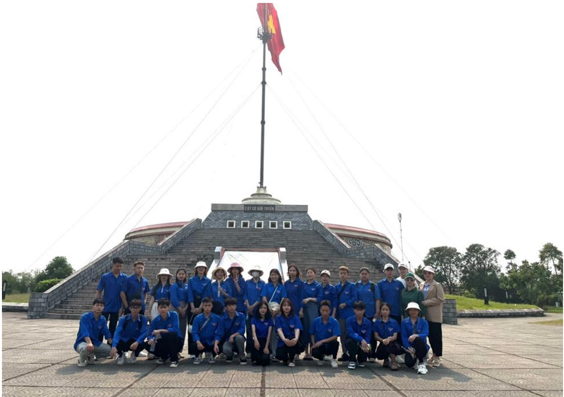
Đoàn chụp hình lưu niệm trước Cột cờ giới tuyến