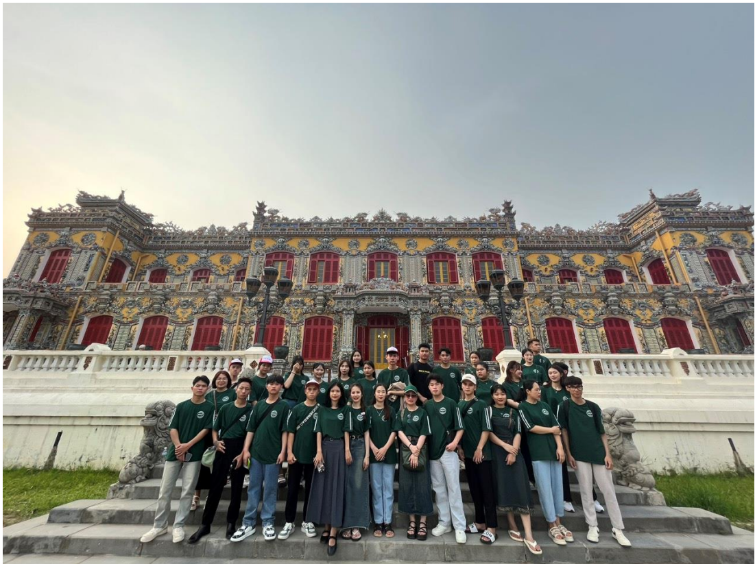
Đoàn chụp hình trước công trình Điện Kiến Trung, mới được mở cửa sau 5 năm trùng tu với mức đầu tư hơn 123 tỷ đồng