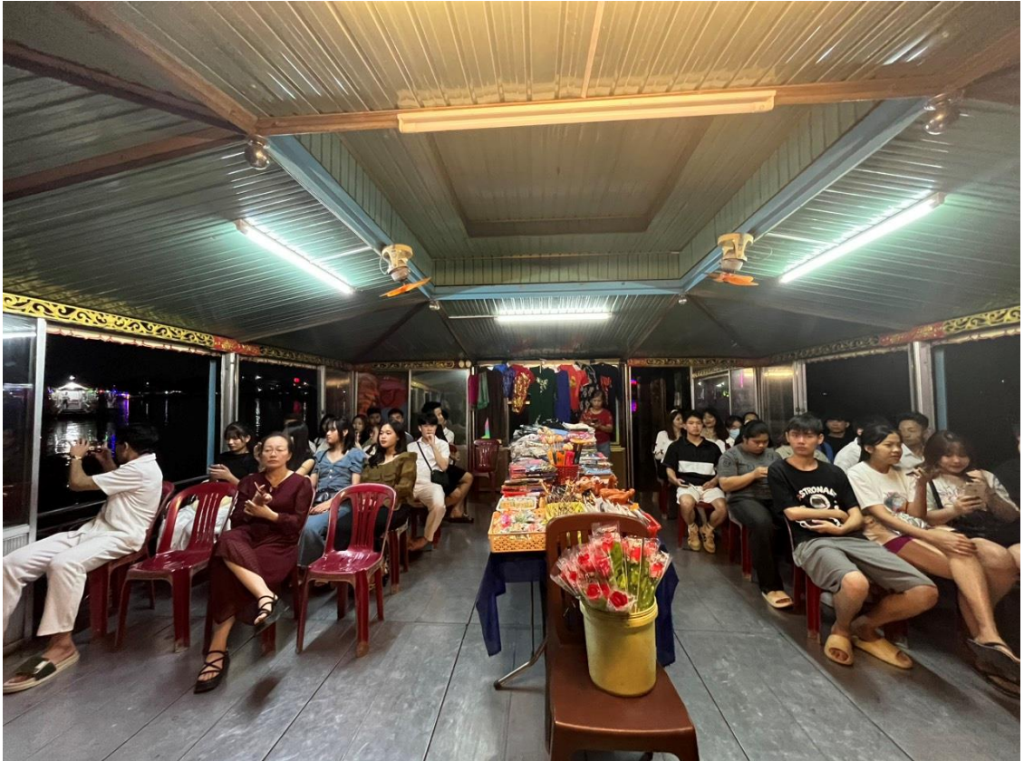
Đoàn thực tế trên thuyền rồng thưởng thức ca Huế trên sông Hương