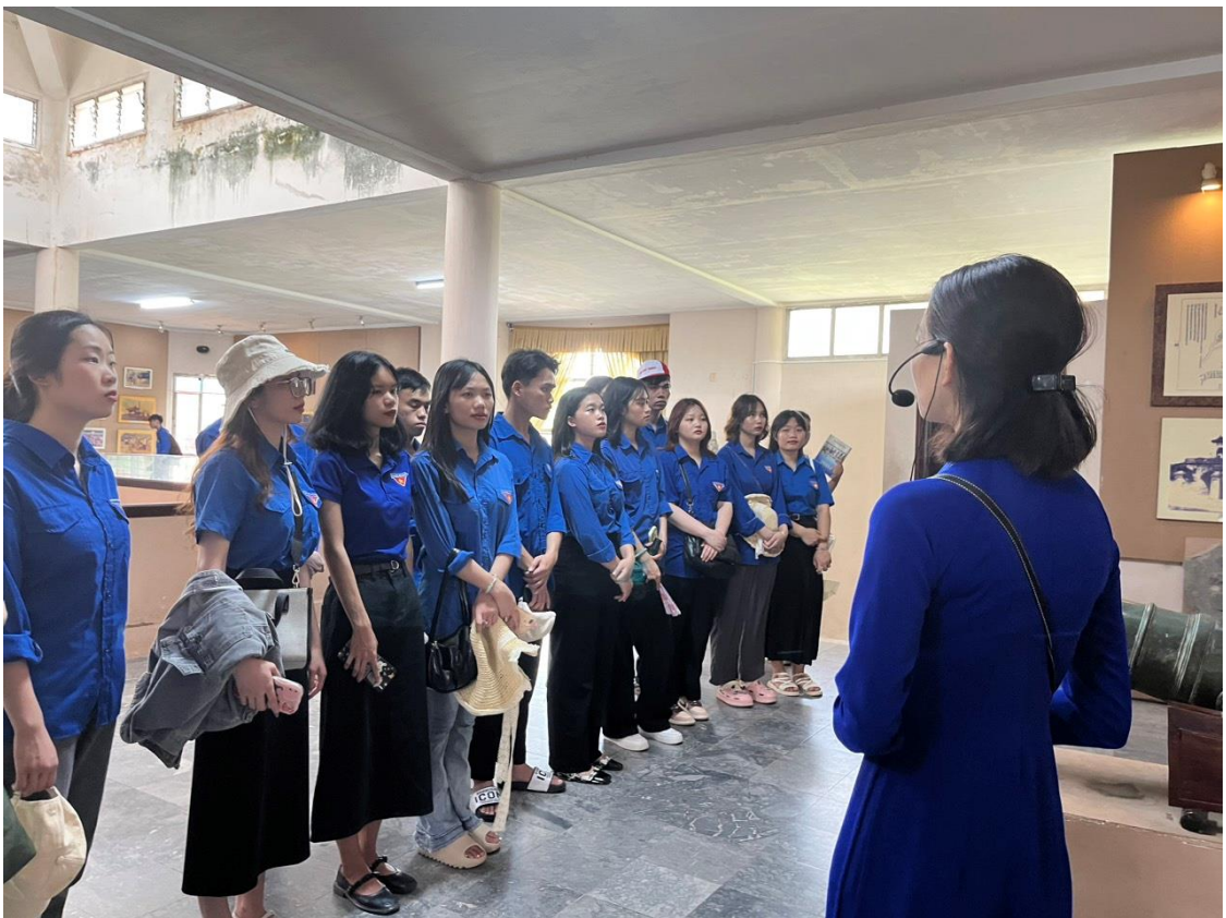
Đoàn nghe thuyết minh trong nhà Bảo tàng Quảng Trị