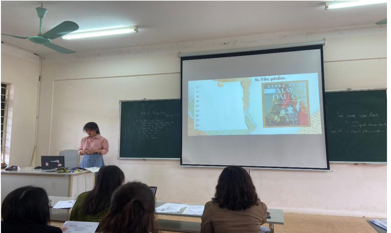
Hình 3: Sinh viên thi giảng