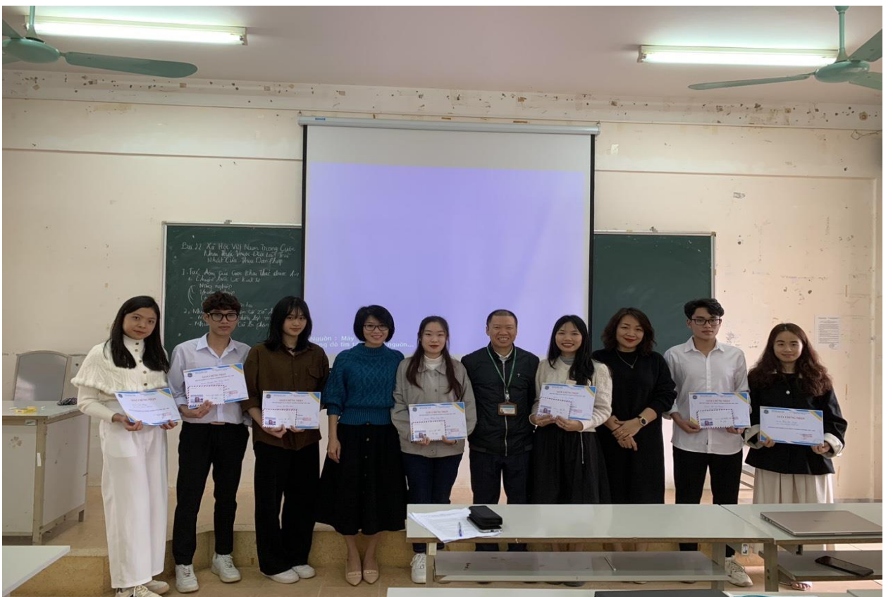
Hình 7: Trao giải nội dung thi giảng