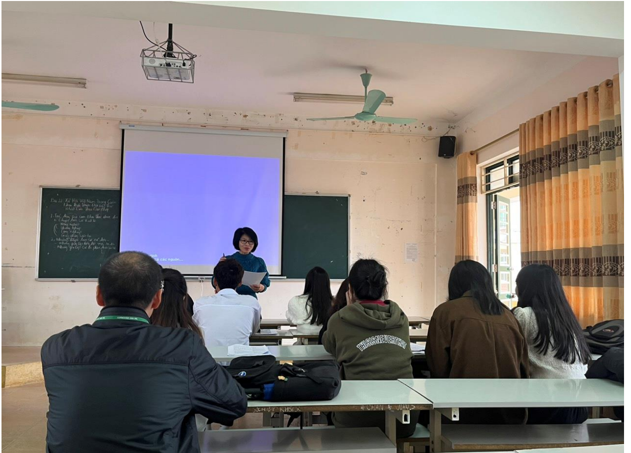
Hình 8: Giảng viên rút kinh nghiệm nội dung thi giảng