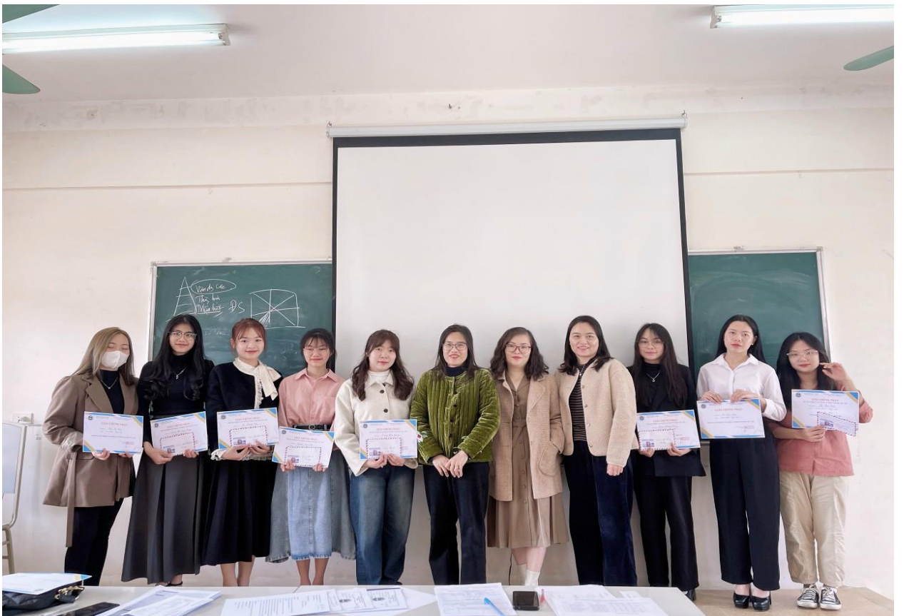
Hình 7: Trao giải nội dung thi giảng