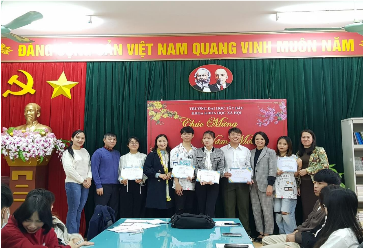
Hình 6: Trao giải nội dung thi Xử lý tình huống Sư phạm