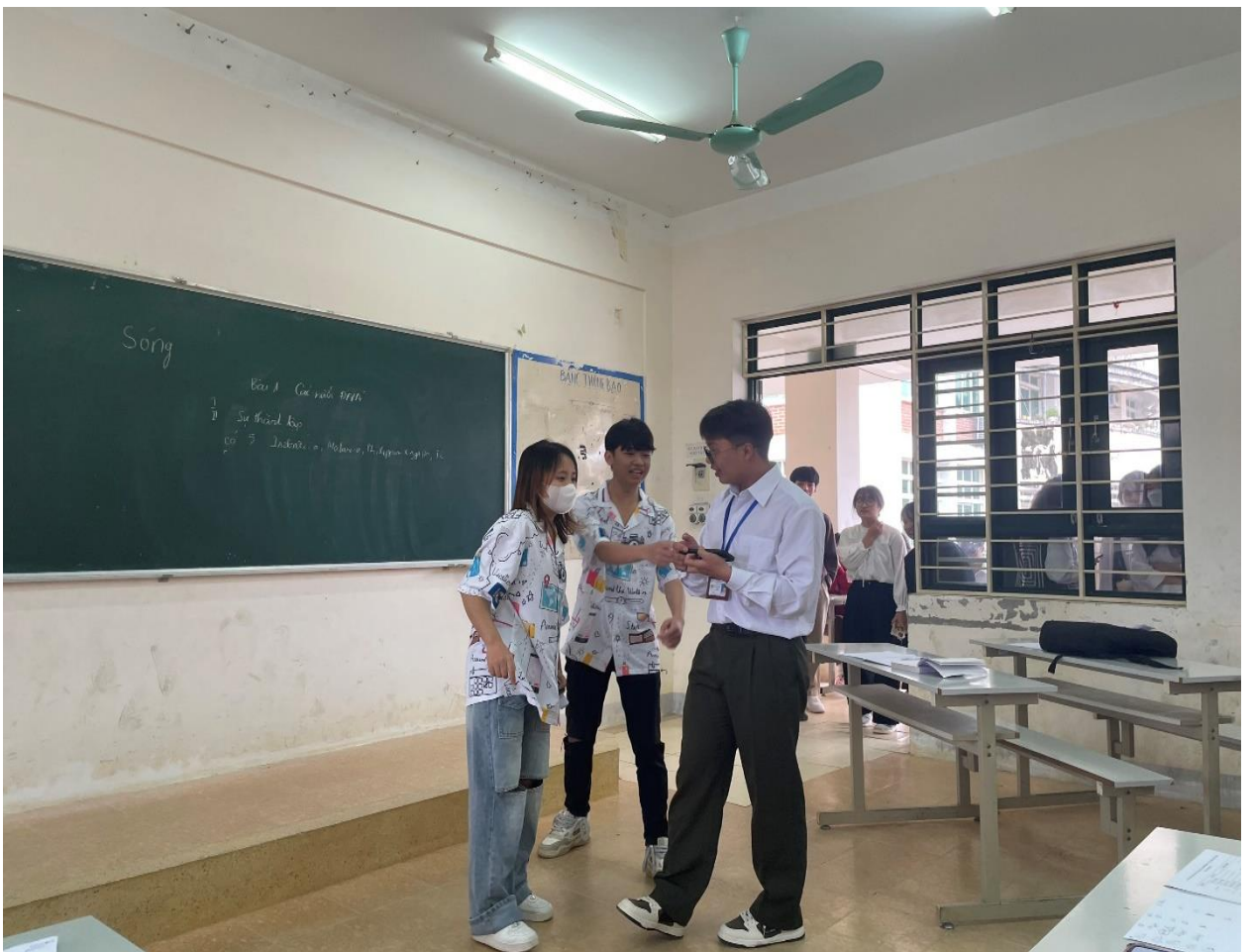
Hình 4: Sinh viên thi xử lý tình huống sư phạm