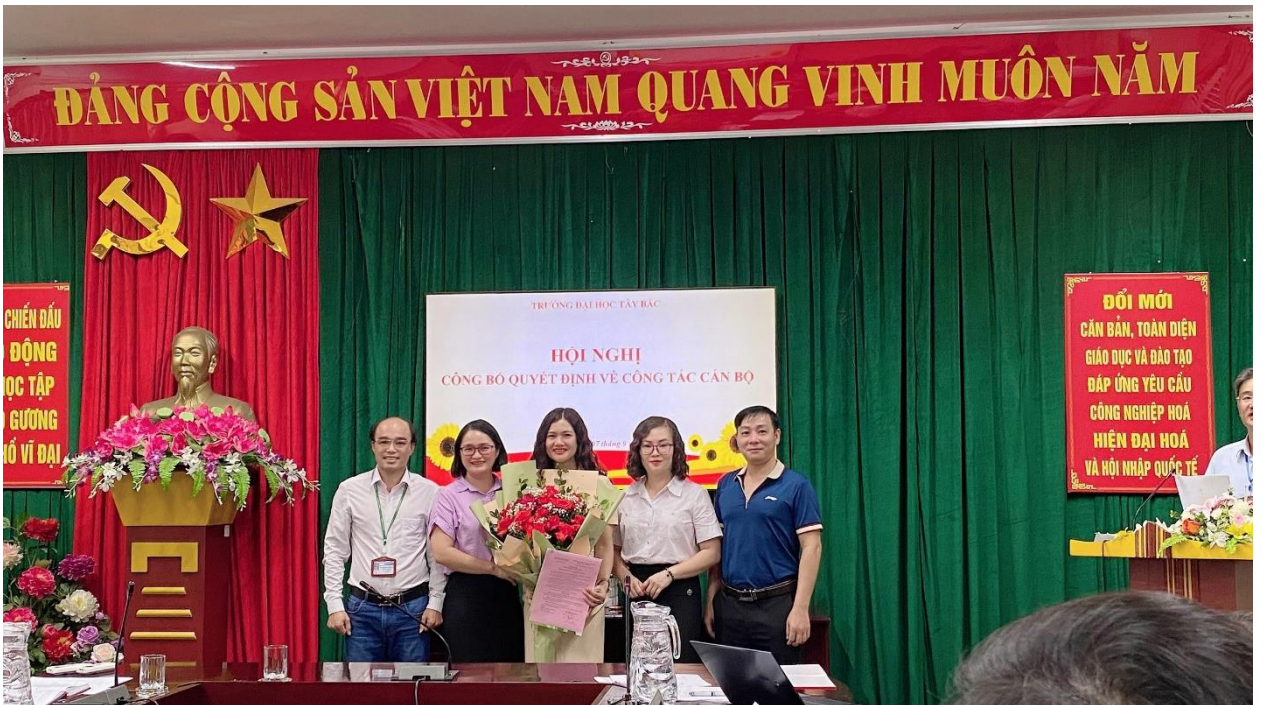
Hình 3: Chi ủy Chi bộ, Công đoàn và các bộ môn Khoa Khoa học Xã hội tặng hoa chúc mừng Tân trưởng Khoa