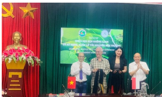
Ảnh 1. Trao quà lưu niệm