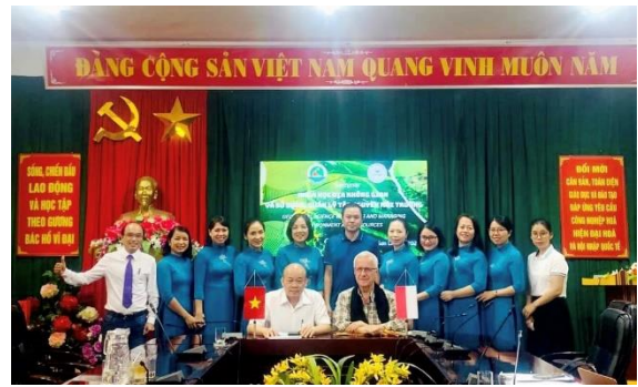
Ảnh 8. Chụp ảnh lưu niệm