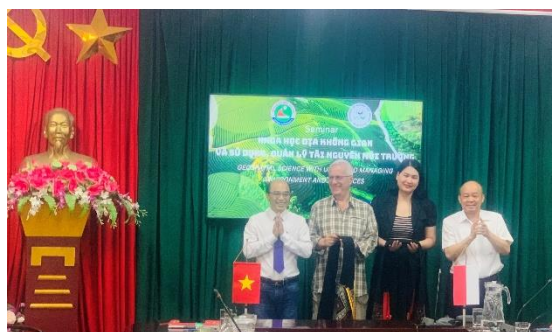
Ảnh 2. Trao quà lưu niệm