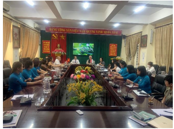
Ảnh 6. Trao đổi chuyên môn