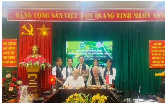
Ảnh 7. Chụp ảnh lưu niệm