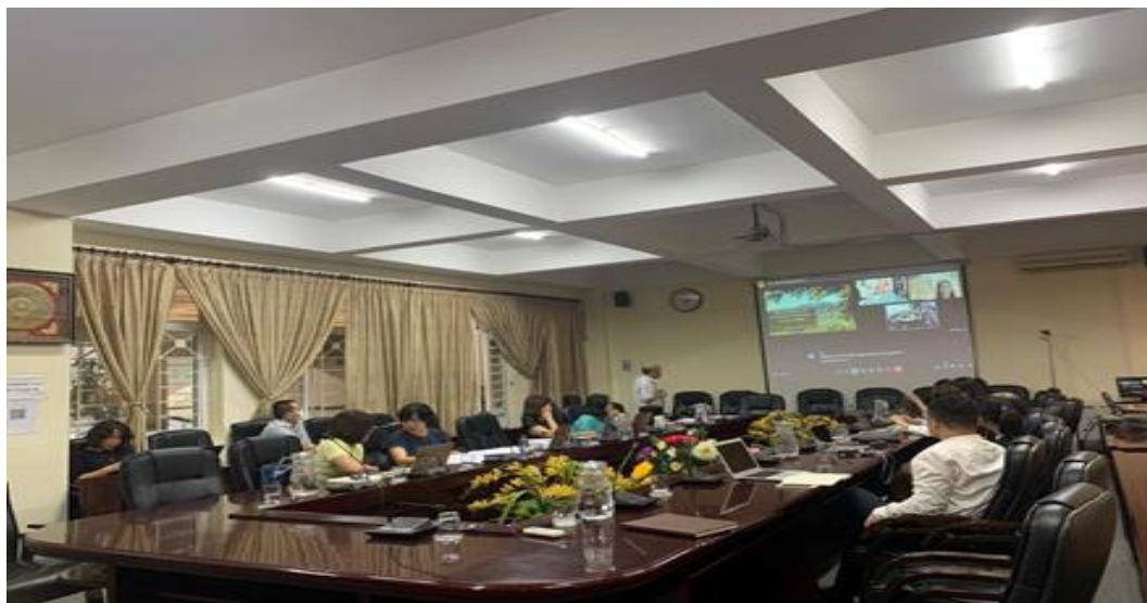
Hình 1: Buổi làm việc trực tuyến giữa Trường ĐH Tây Bắc và ĐH UWM

Tại buổi làm việc, hai trường đã giới thiệu về thế mạnh, kinh nghiệm và tiềm năng nghiên cứu. Các giảng viên bộ môn Địa lý đã chia sẻ về thành tựu và hướng nghiên cứu của mình. Kết thúc buổi làm việc, hai bên nhận định có nhiều cơ hội hợp tác trong nâng cao chất lượng giảng dạy, nghiên cứu Khoa học Địa lý và xuất bản các công bố trên các tạp chí Quốc tế.